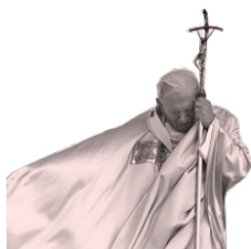
Coluna João Paulo II

disse Jesus: "Eu sou a luz do mundo. Quem me segue não caminha nas trevas, mas terá a luz da vida." (Jo 8,12)