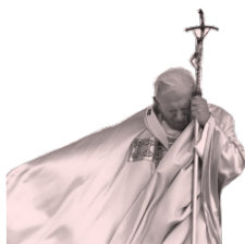
Coluna João Paulo II

disse Jesus: "Eu sou a luz do mundo. Quem me segue não caminha nas trevas, mas terá a luz da vida." (Jo 8,12)