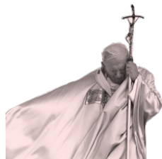
Coluna João Paulo II

disse Jesus: "Eu sou a luz do mundo. Quem me segue não caminha nas trevas, mas terá a luz da vida." (Jo 8,12)