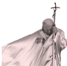
Coluna João Paulo II

disse Jesus: "Eu sou a luz do mundo. Quem me segue não caminha nas trevas, mas terá a luz da vida." (Jo 8,12)