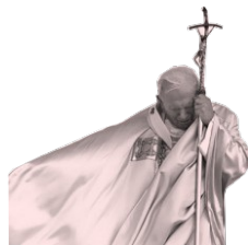
Coluna João Paulo II

disse Jesus: "Eu sou a luz do mundo. Quem me segue não caminha nas trevas, mas terá a luz da vida." (Jo 8,12)