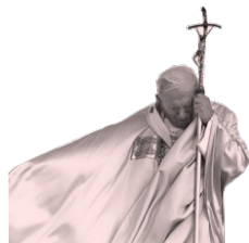
Coluna Joao Paulo II

“..quero fazer de ti uma luz para as nações, para que a minha salvação chegue até os confins da terra.” (Is 49,6)