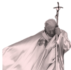
Coluna João Paulo II

disse Jesus: "Eu sou a luz do mundo. Quem me segue não caminha nas trevas, mas terá a luz da vida." (Jo 8,12)