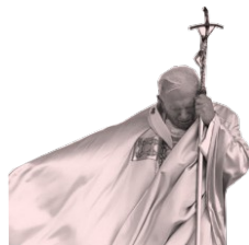
Coluna Joao Paulo II

“..quero fazer de ti uma luz para as nações, para que a minha salvação chegue até os confins da terra.” (Is 49,6)