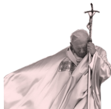
Coluna João Paulo II

disse Jesus: "Eu sou a luz do mundo. Quem me segue não caminha nas trevas, mas terá a luz da vida." (Jo 8,12)