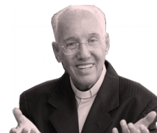
Coluna Jonas Abib

(Documento de Apresentação/Catecismo da Igreja Católica)