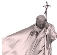
Coluna Joao Paulo II

“Urge um empenho extraordinário de evangelização...”