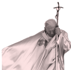
Coluna Joao Paulo II

"..quero fazer de ti uma luz para as nações, para que a minha salvação chegue até os confins da terra." (Is 49,6)