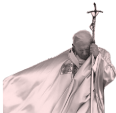
Coluna Joao Paulo II

“Não subistes nas brechas, não construístes muro algum em torno da casa de Israel para resistir ao combate no dia do Senhor.” Ez(13,5)