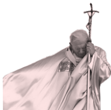
Coluna Joao Paulo II

“..quero fazer de ti uma luz para as nações, para que a minha salvação chegue até os confins da terra.” (Is 49,6)