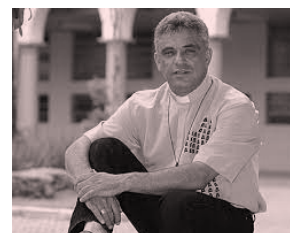
Coluna Padre Léo