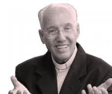
Coluna Jonas Abib

(Documento de Apresentação/Catecismo da Igreja Católica)